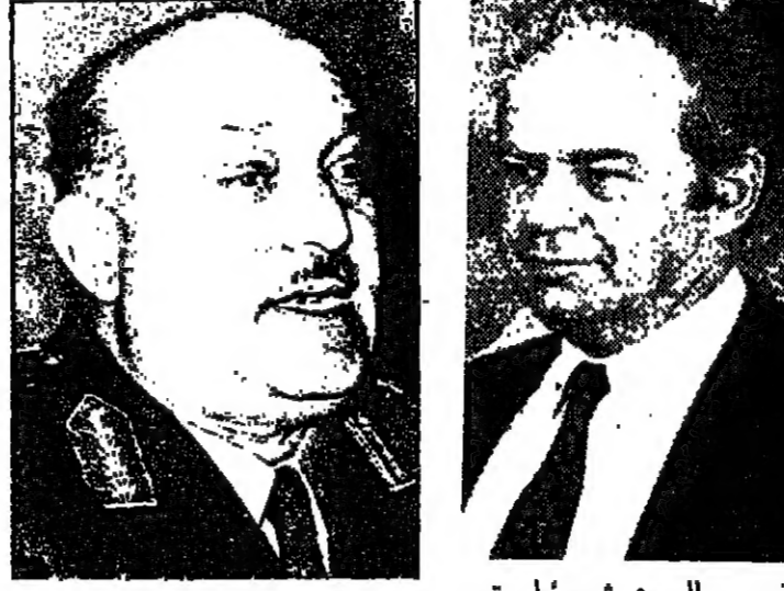
وزير العدل محمد بن مسلمة

قاهرة - تستأنف في القاهرة بعد غد الاحد محادثات الحكم الاداري الذاتي في الضفة الغربية وقطاع غزة . تم اتفاق بهذا الشأن بين وزير الخارجية المصرية والاسرائيلية ، ويستتجبه للجنة القانونية لسة السيد شموشيل تيمرويزر العدل الى القاهرة بعد غد لابتدائها المفاوضات التي توقفت قبل شهرين ونصف الشهر ، بشأن ماهية الحكم الذاتي .